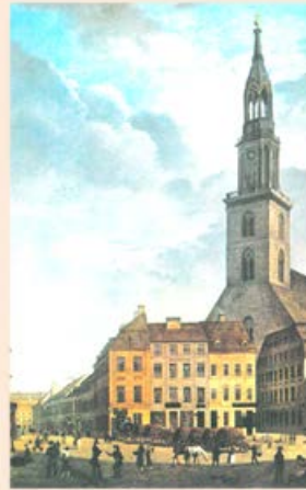
マリエン教会 1828年図版より